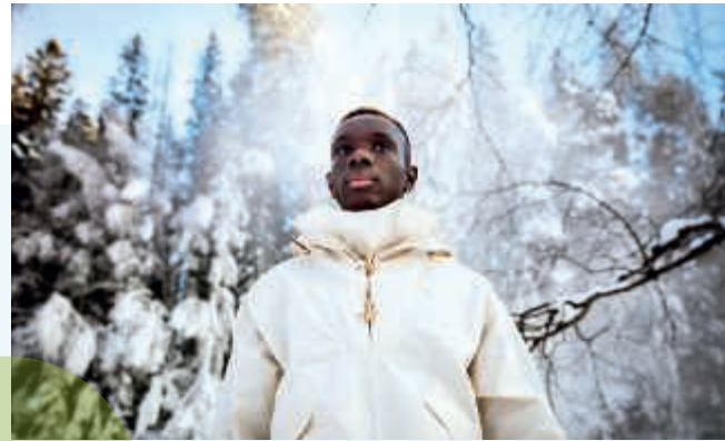
Anorak de Bergans Collection of Tomorrow.

"En el VTT hemos desarrollado un método de producción que resuelve un cuello de botella en la manufactura del producto", afirma Szilvay. "Esta tecnología permite un escalado de la producción fácil y rentable a nivel industrial. La próxima generación de cuero de micelio podría estar en producción comercial en un plazo de dos a cinco años".